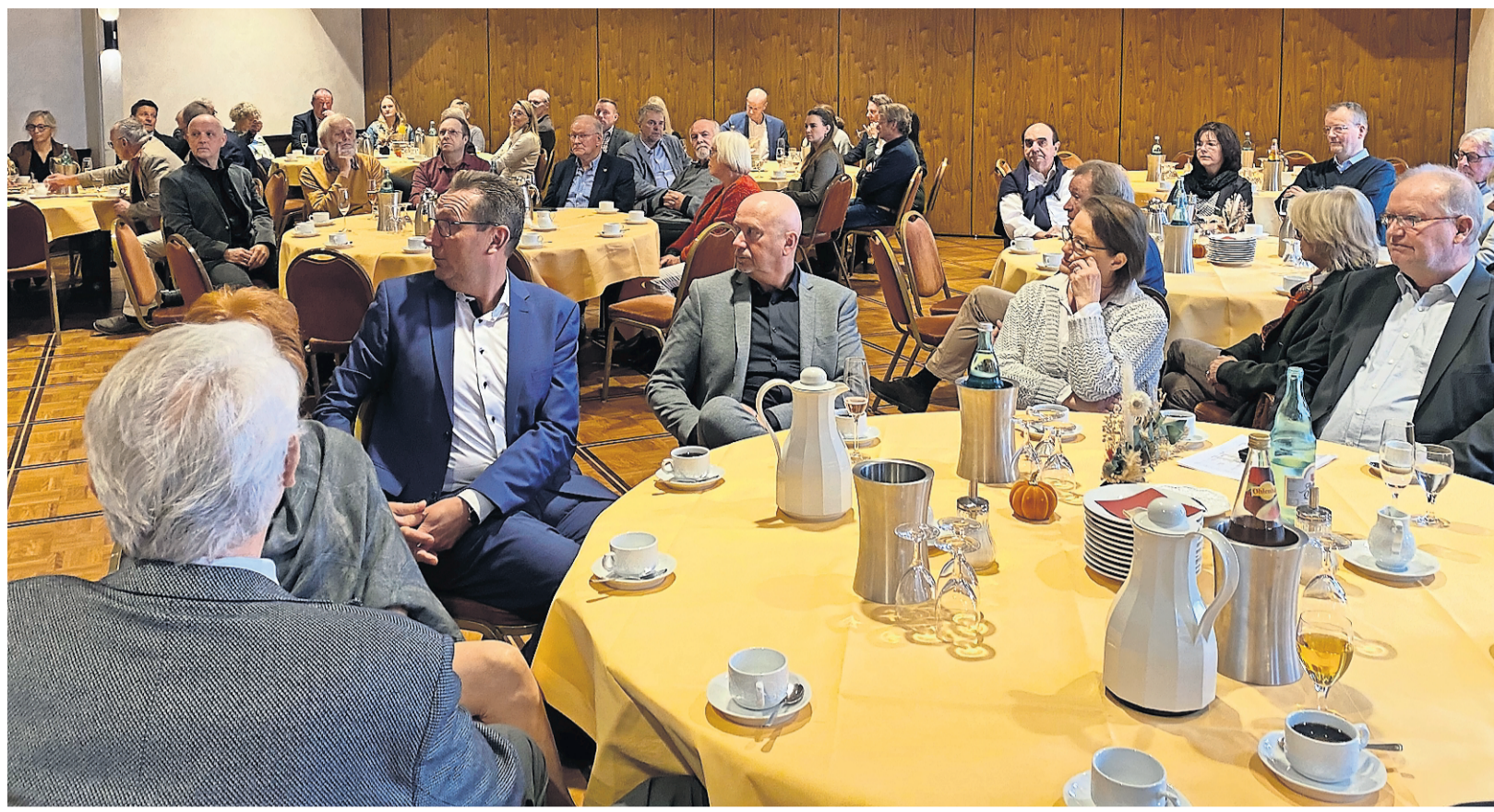
Rund 60 Gäste nahmen am Sonntag am traditionellen Frühschoppen der Bremervörder Wirtschaftsgilde im Hotel Daub teil.

Um die Müllbeseitigung im Elbe-Weser-Dreieck möglichst kostengünstig hinzubekommen, ist die Gründung eines Zweckverbandes oder einer Gesellschaft angedacht worden. Schon in nächster Zukunft werde es darüber Gespräche mit den Nachbarkreisen geben, kündigt Brunkhorst an.